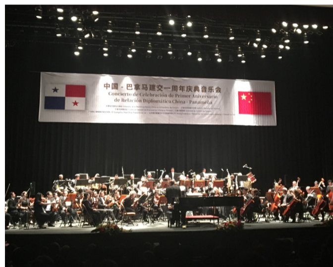
《中巴建交一周年音乐会》（石雷力）

我看重结果胜于过程，如果仅仅因为自己那点可怜的自尊心和害怕受伤脆弱的内心而没有用尽全力追寻自己内心所爱，最后徒留遗憾，甚至只能面对不满意的结果自我安慰或是自怨自艾，最怕你一生碌碌无为还安慰自己平凡可贵。我很确定，这是弱者的自欺，而我选择挑战，哪怕过程很痛苦，但是最后的结果定会是美好的。（徐翔宇）