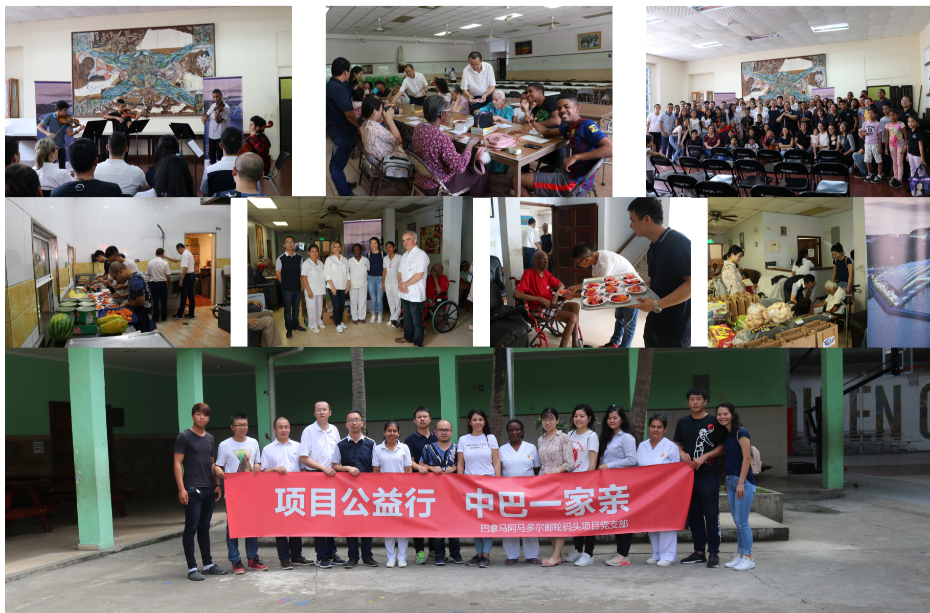
项目公益行 中巴一家亲 巴拿马阿马多尔邮轮码头项目党支部

按照活动计划，项目部除定期开展慰问社区敬老院、做义工、赞助音乐教室等活动以外，还将陆续开展公益登山、骑行活动、赞助社区贫困家庭儿童夏季足球赛、修建公益涂鸦墙等。项目党支部希望通过参与公益活动的方式，树立项目部良好形象，彰显中华民族的传统美德和优秀的企业文化，向巴拿马社会各界展示企业高度的社会责任感。（韩亚伦）