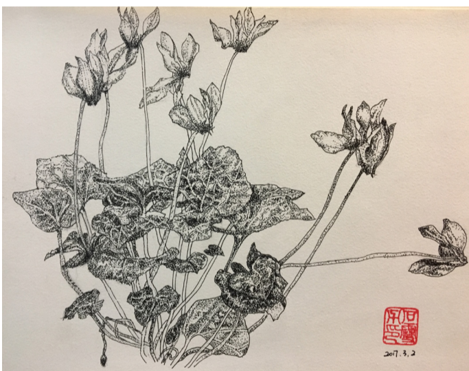
钢笔画-《芙蓉花》（石雷力）