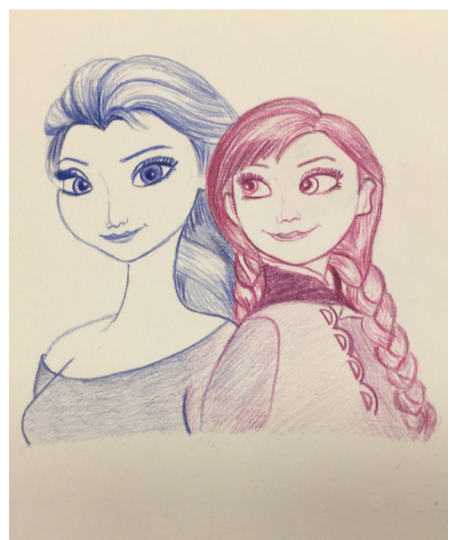
彩铅画-《冰雪奇缘》（石雷力）