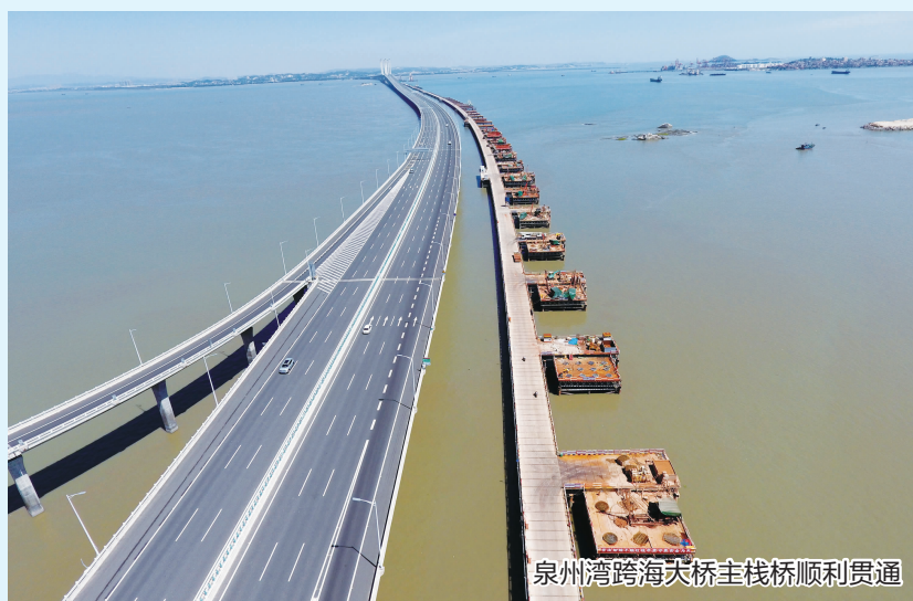
泉州湾跨海大桥主栈桥顺利贯通

“尊敬的各位旅客,前方到站泉州站……”,伴随着列车悠扬的到站提醒声,2018年7月16日下午3时40分,我来到了这个距离家乡1600多公里陌生的城市。在这里,是全国首条跨海高铁新建福厦铁路6标的项目驻地。我深知,从此“福厦”二字将要深深地刻在我的人生履历当中。