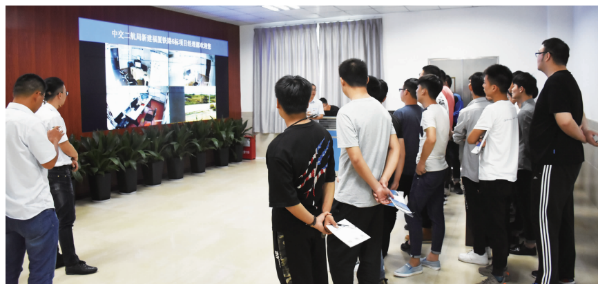
项目管控中心全天候、全方位、无死角监控

项目严格按“精品工程、智能福厦”总体实施方案和2017年12月1日铁路建设电视电话会议精神,要求以“数字郑万”、“智能京张”为信息化建设蓝本,按照公司“八高九建”建设要求,以“统一平台,需求导向,全面覆盖,BIM探新”为总体思路,项目高度重视,结合项目实际,制定健全、针对性、可操作性强的管理体系,专门成立信息化小组和信息化办公室,配置专职信息化管理员,通过以建设管理和施工应用需求为导向,以铁路工程管理平台为载体,在标段内全线推广了二维码平台应用,积极开展BIM技术应用,通过信息化手段智能管理和监测,确保施工现场通过管理平台全天候无死角监控,设备、机械通过北斗卫星系统实时定位,从高精度智能传感器开始,通过Lora节点到虚拟地形,桥